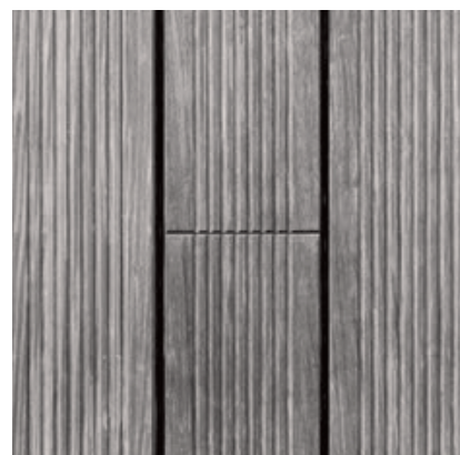
Abstufung der Vergrauung von Bamboo X-treme im Laufe der Zeit: neue, nicht verwitterte Terrassendielen (links), 3 Monate der Witterung ausgesetzt (Mitte) und 18 Monate der Witterung ausgesetzt (rechts).